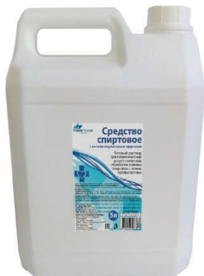
PROMETHEUS ENERGY PE-ss-5

Поставка антисептиков в канистрах по 5 литров