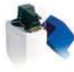
DAS12 Depuratore cabinato 12 litri a timer automatico. Boxed automatic 12-liters purifier with automatic timer.