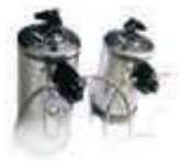
DA12 DA8 Depuratore automatico Automatic purifier DA12, 12-liters / DA8, 8-liters.