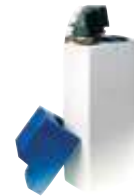
DAS26 Depuratore cabinato 26 litri a timer automatico. Boxed automatic 26-liters purifier with automatic timer.