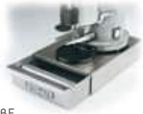
BF Cassetto "battifondi" per macinadosatore, acciaio inox. Knock-out box & base for espresso grinder, stainless steel.