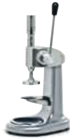
CSP Pressino Dinamometrico. Dynamometric Tamper.