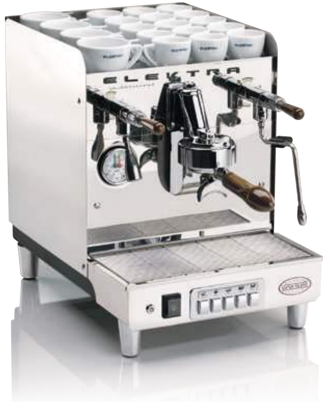
SIXTIES T1. 1 GRUPPO AUTOMATICA. ACCIAIO INOX SUPER LUCIDO SIXTIES T1. 1 UNIT AUTOMATIC. ULTRA POLISHED INOX

PICCOLI GRANDI PIACERI ITALIANI SMALL AND BIG ITALIAN PLEASURES