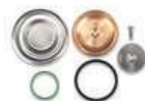
02361034 Kit Cialda Kit for Pods