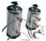
DVA12 DVA8 Depuratore Purifier DVA12, 12-liters / DVA8, 8-liters