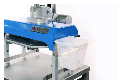
Удобный съемный лоток для муки с крышкой, который можно установить с левой или правой стороны машины.