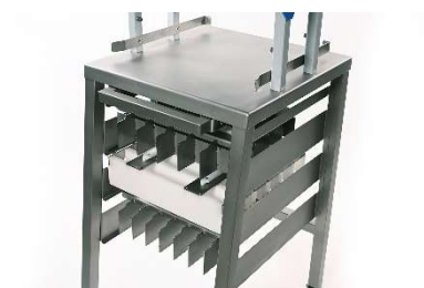
Рама с возможностью хранения 4 решеток для нарезки и формования теста.