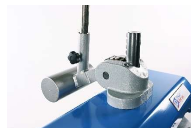
Прочный чугунный зубчатый механизм, обеспечивающий длительный срок службы и бесперебойную работу.