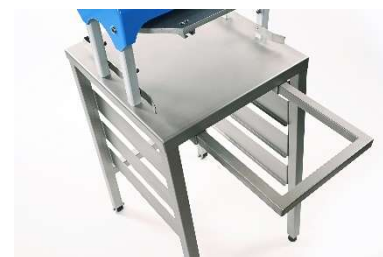
Выдвижной вспомогательный столик для бункера для теста для дополнительного удобства.