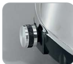
Modello VV: variatore di velocità Speed control optional