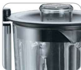
Micro su coperchio Microswitch on cover