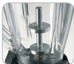
Modello caffè Coffee model