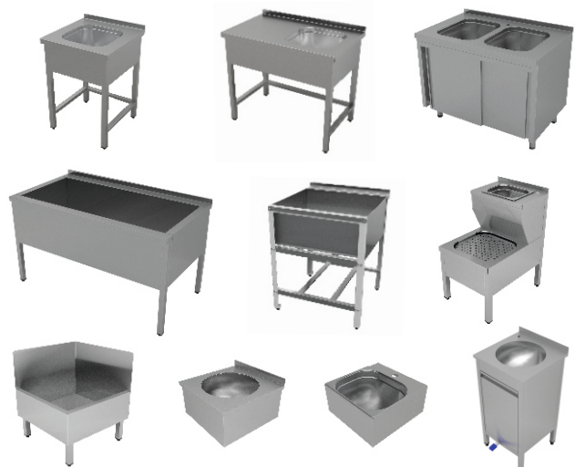
Ванны моечные, котломойки и рукомойники