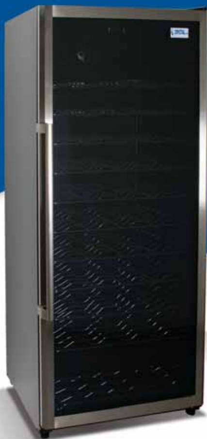
CRW 350 B