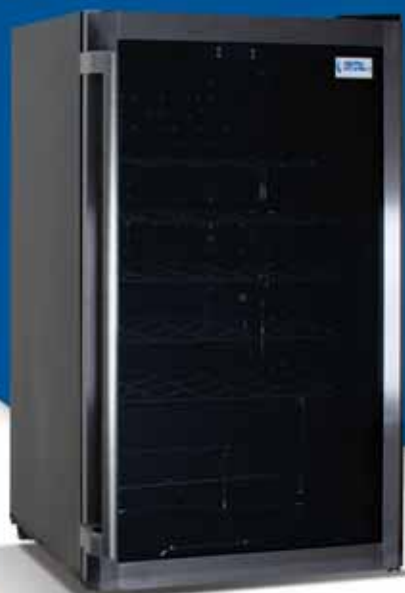
CRW 100 B