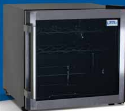
CRW 50 B