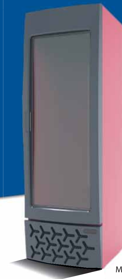
MIRA (CRF 300)