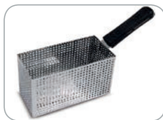
Cestello maxi: di serie per mod. 10 / opzionale per mod. 8 Maxi basket: standard for mod. 10 / optional for mod. 8