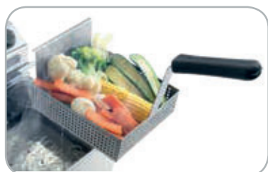
Cestello per cottura a vapore opzionale Optional steam cooking basket