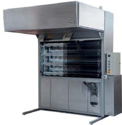
PR 1 216