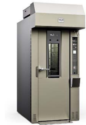
ROTOR SLIM PRO