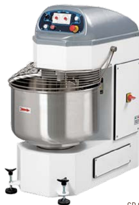
SP 60 ONE