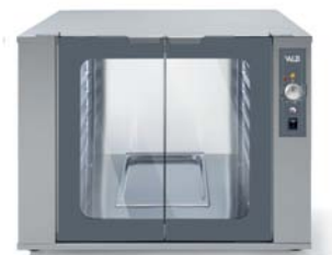
WLBIEV 1264 M