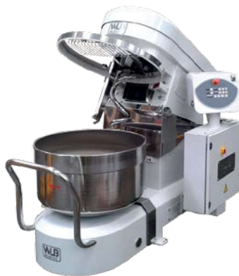
SPR 80 N