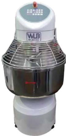
SP 60 N