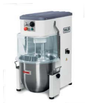
PM 20B VAR