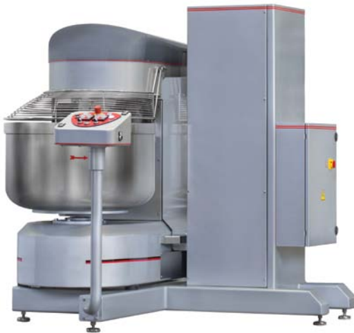
SPOT 120 N