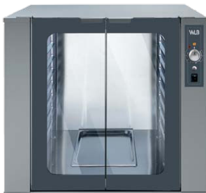
VPF 864 M