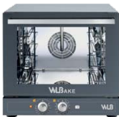
V 464 MR