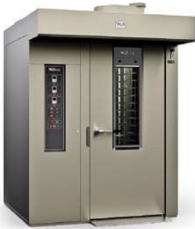
ROTOR FR Smart 60x80 (ЭЛЕКТРОМЕХАНИЧЕСКАЯ ПАНЕЛЬ)