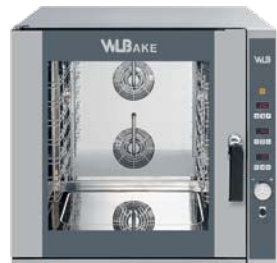
WB 664 ER