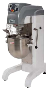
PM 40 VAR