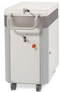
MHD SA 20