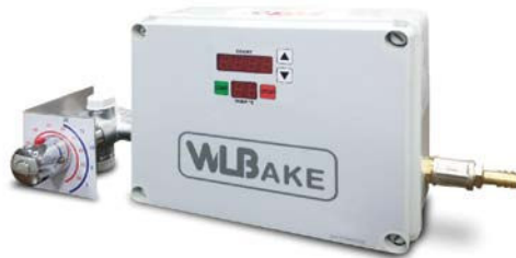
WLD 25 ECO