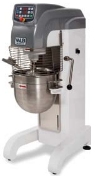
PM 40 EVAR