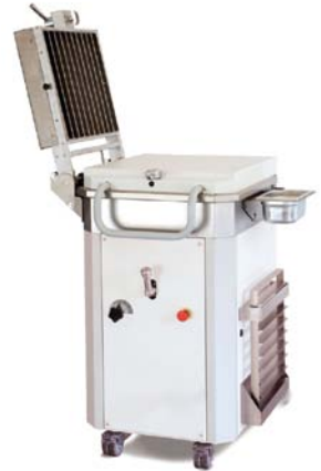
MHD SA 20 T