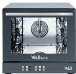
V 464 ER