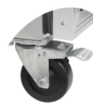
Прочные колеса по заказу