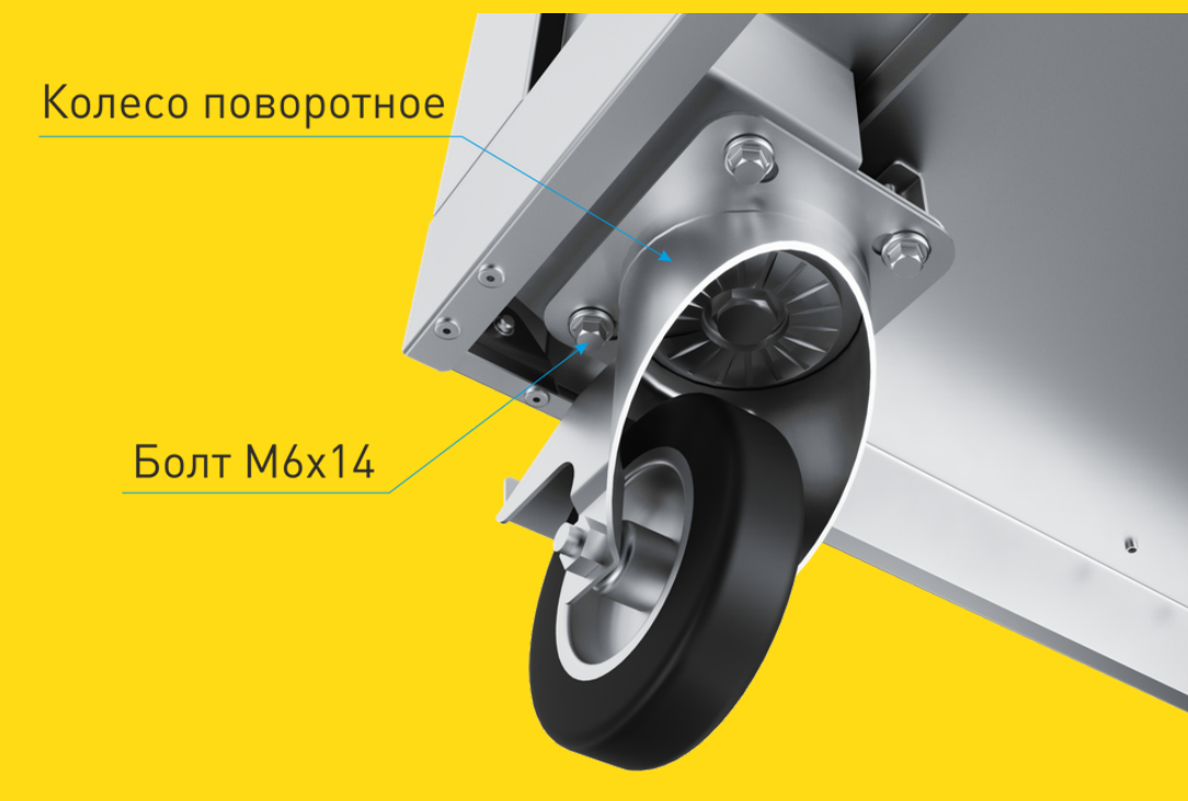
Вид снизу. Установка поворотного колеса