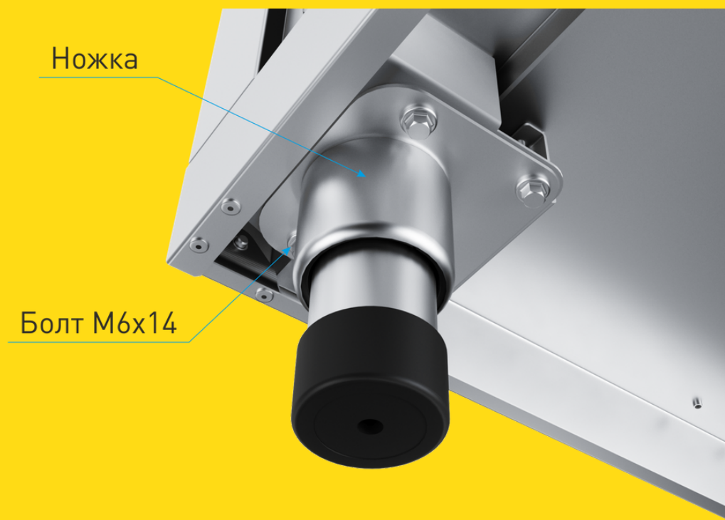
Вид снизу. Демонтаж

Для удобства установки и перемещения изделий