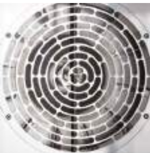
оптимальный воздушный поток