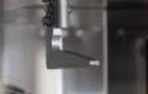
вращение с помощью крюка