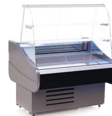
OCTAVA K (+1...+10 °C) КОНДИТЕРСКИЕ ВИТРИНЫ