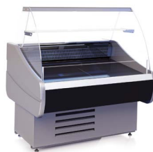
OCTAVA SN (-6...+6 °C) СРЕДНЕ-НИЗКОТЕМПЕРАТУРНЫЕ ВИТРИНЫ