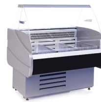
OCTAVA M (-15...-13 °C) НИЗКОТЕМПЕРАТУРНЫЕ ВИТРИНЫ