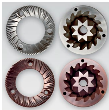
macine piane, coniche e red speed lunga durata flat, conical and red speed long duration blades