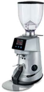
F64 E XGi pag. 14