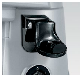
pressino laterale destro o sinistro right or left side tamper