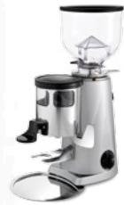
F4 nano pag.22