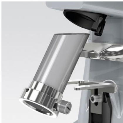
tubo estraibile per facilitare la pulizia removable tube to make cleaning easier