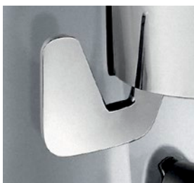
dosatore sinistro / LH dispenser