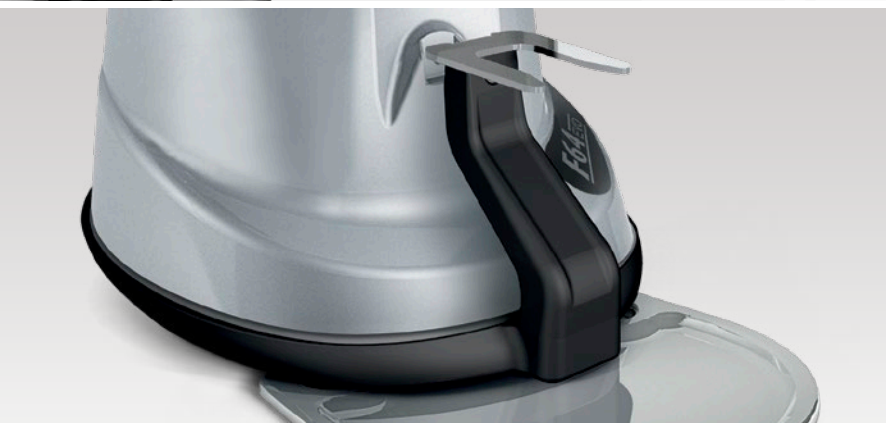
dispositivo per la taratura e la pesatura della dose di caffè device used to calibrate and weigh the dose of coffee

Thanks to the innovative patent of the XGi coffee grinder, the quantity of coffee dispensed, calculated in grams and set ONLY ONCE, will not change, guaranteeing precise doses and avoiding any waste.