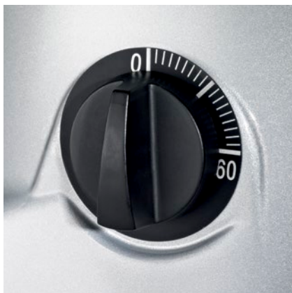
interruttore timer timer switch