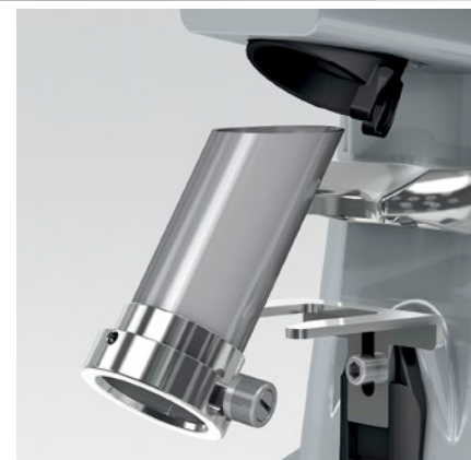
tubo estraibile per facilitare la pulizia removable tube to make cleaning easier