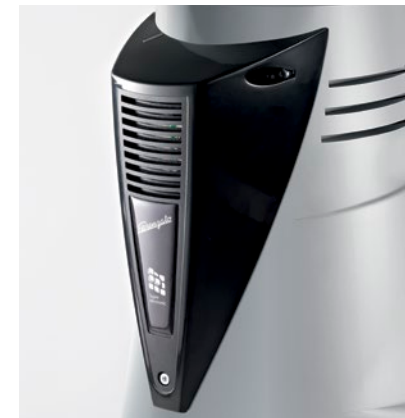
ventola di raffreddamento automatica automatic cooling fan