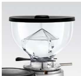
campana 250g / coffee bean hopper 250g