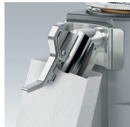
blocca sacchetto bag retainer