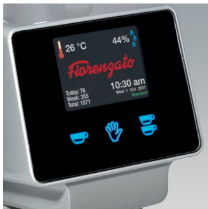
display touch touch display