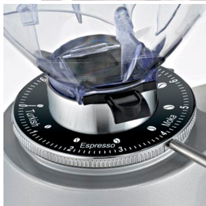
regolatore macinatura micrometrica micrometric grinding adjustment