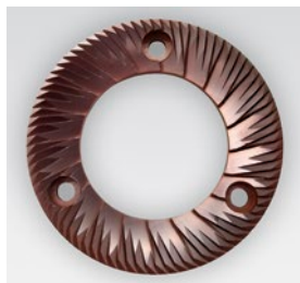
macine red speed / red speed blades