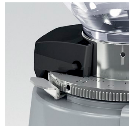
blocco ghiera - blocco campana ring nut lock - coffee bean hopper lock