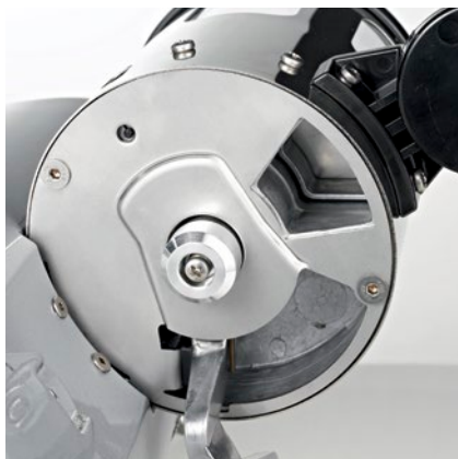
regolazione dose dose adjustment