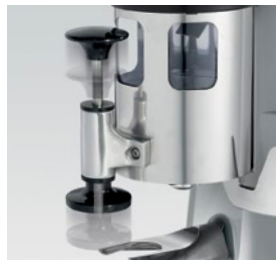
pressino telescopico / telescopic tamper