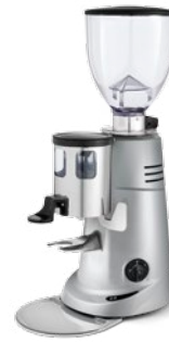
F6 pag. 24