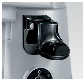
pressino laterale destro o sinistro right or left side tamper