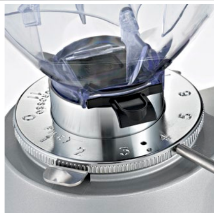
regolatore macinatura micrometrica micrometric grinding adjustment