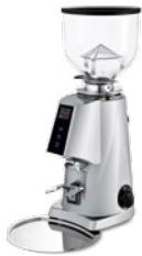
F4 E nano pag. 30