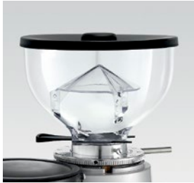
campana 250g / coffee bean hopper 250g