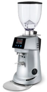
F71 KE pag. 35