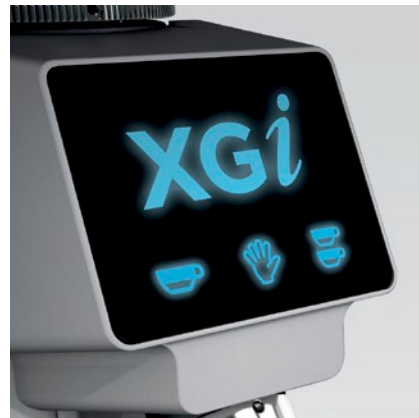
display touch touch display