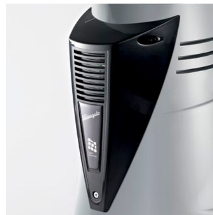
ventola di raffreddamento automatica automatic cooling fan