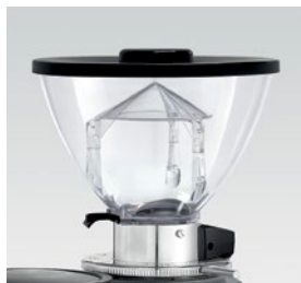
campana 500g / coffee bean hopper 500g