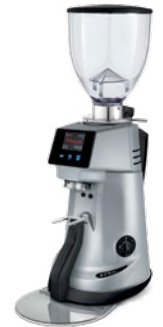
F71 KE XGi pag. 18