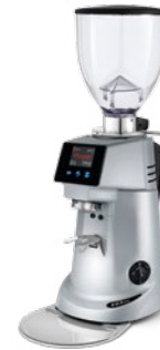
F63 KE pag. 34