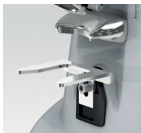
forcella regolabile / adjustable fork