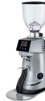
F63 KE XGi pag. 17