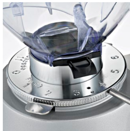
regolatore macinatura micrometrica micrometric grinding adjustment