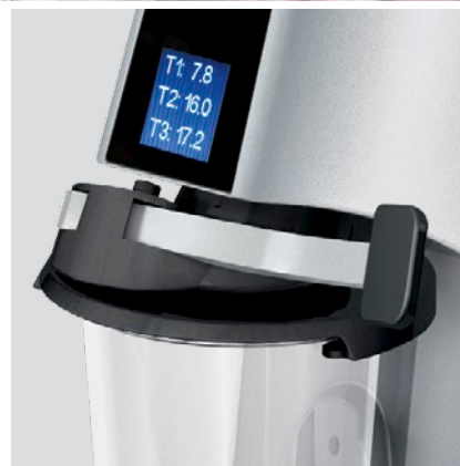
leva blocco bicchiere beaker locking lever