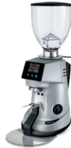
F64 EVO XGi pag. 15