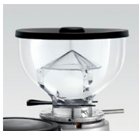
campana 250g / coffee bean hopper 250g