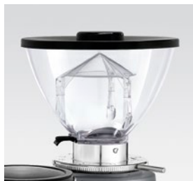
campana 500g / coffee bean hopper 500g