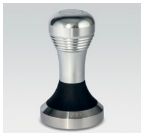
pressino in metallo / metallic tamper