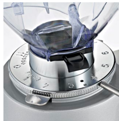
regolatore macinatura micrometrica micrometric grinding adjustment