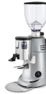
F63 K pag. 25