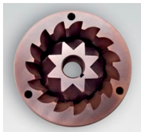
macina red speed / red speed blades