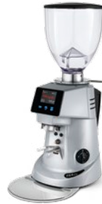
F64 EVO pag. 32