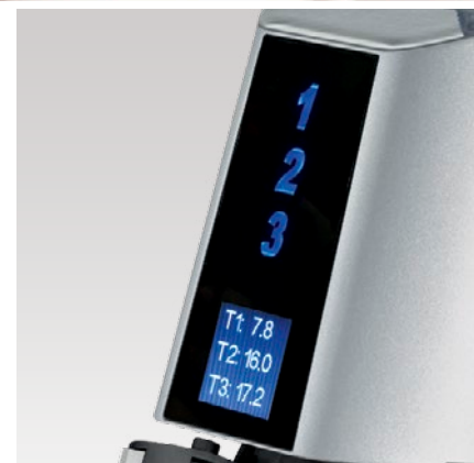
display touch touch display