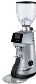
F83 E XGi pag. 16