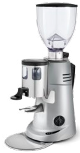
F71 K pag. 26