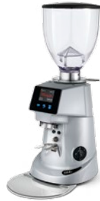
F64 E pag. 31