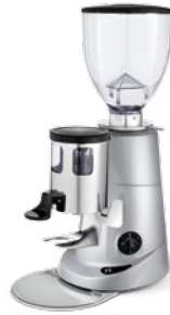
F5 pag. 23