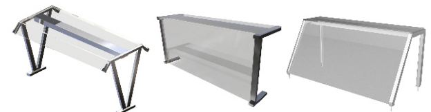
V-образные Г-образные Наклонные

*Изображены три самые популярные модификации