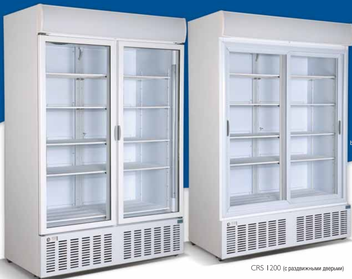
CR 1300 (с открывающимися дверьми)