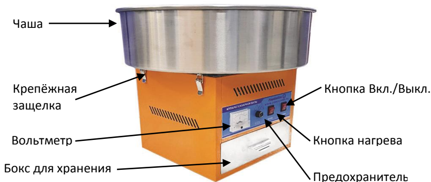
Рис.1 – Аппарат для приготовления сладкой ваты