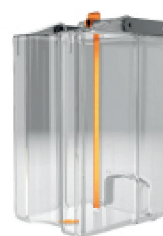
Контейнер для молока