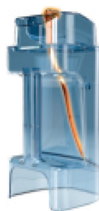
Контейнер для очистки молочной системы