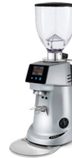
F63 KE pag. 34