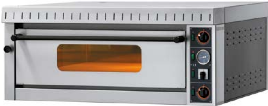
MD 4 | MD 6

electric pizza oven four électrique à pizza horno para pizzería