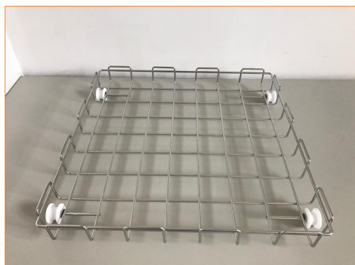
Универсальная кассета 206708 (665x665 мм)