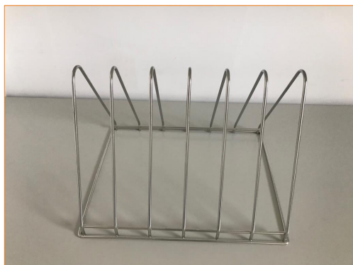
Вставка для подносов и противней TR0926

Кассеты 1 универсальная кассета, 1 вставка для подносов и противней Комплект подключения 1 шланг для подключения к воде