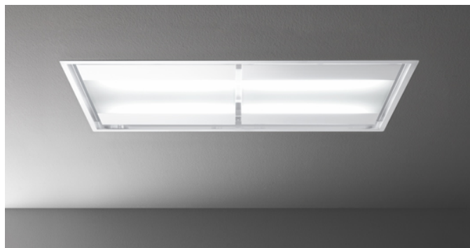
Фотография исключительно для информации Может не соответствовать выбранной версии.