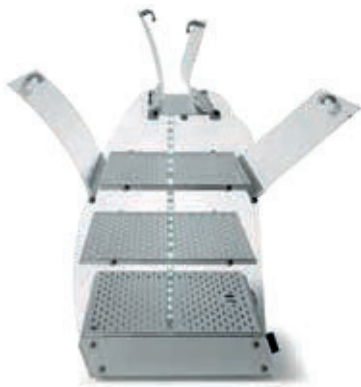
VISTA P3 BOLD