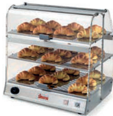
VISTA P3 BOLD BRIOCHE