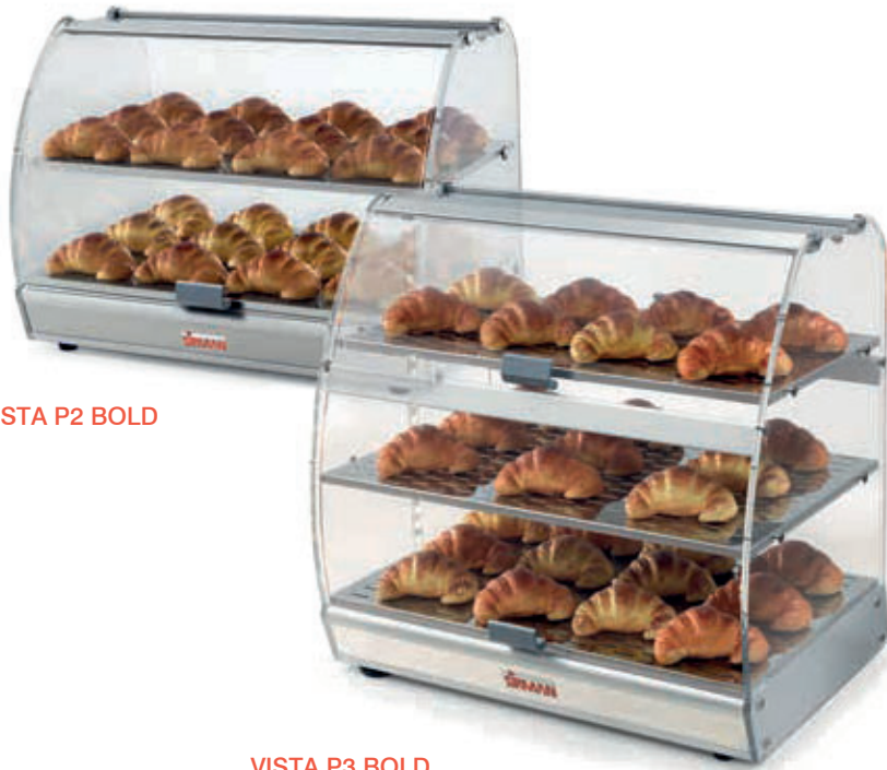
VISTA P2 BOLD