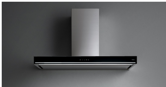
Фотография исключительно для информации Может не соответствовать выбранной версии.