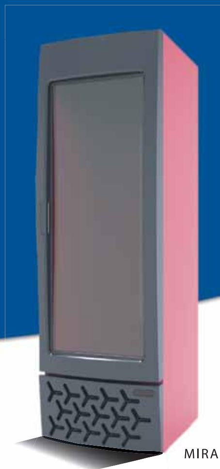
MIRA (CRF 300)