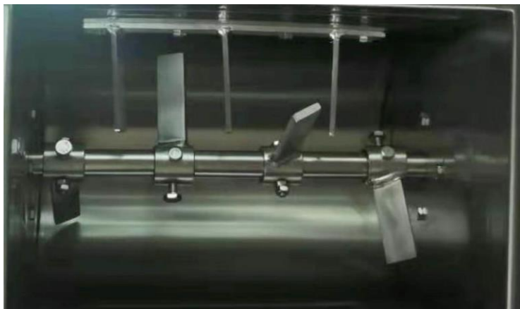
Месильный орган - J