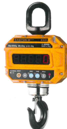
Весы Caston-III (ТНД)