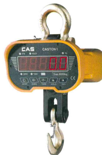
Весы Caston-I (ТНА) (MAX=1, 2, 3, 5 т)