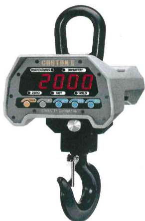
Весы Caston-II (ТНВ)