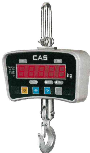
Весы Caston-I (ТНА) (MAX=0.5 т)