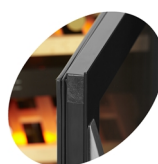
Дверь без рамы