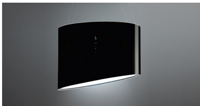
Фотография исключительно для информации Может не соответствовать выбранной версии.

Тип установки Островные Габаритные размеры 80 см Отделка Black glass Мотор 600 м³/ч Тип управления Сенсорное управление Количество скоростей 3 Освещение Неон 3x13 W Фильтр 2 x Metallic filter "Base" - 245x190 mm Угольный фильтр Carbon.Zeo filters (2x) (Входит в комплектацию) Минимальное расстояние Газовая поверхность: 60 см Электр. поверхность: 52 см