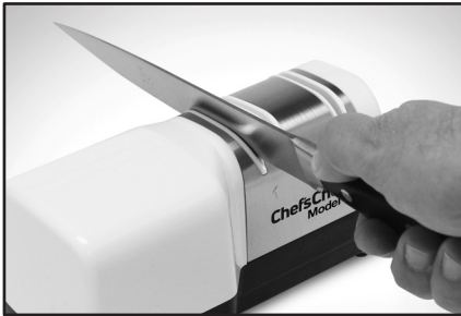
Рисунок 1. Вставка лезвия в левый слот устройства Этап 1. Чередуйте отдельные протяжки в левом и правом слотах.

Если нож перед заточкой не очень тупой, то для придания лезвию остроты достаточно всего 5 пар протягиваний поочередно левой и правой стороной Этап 1. Однако если нож изначально сильно затуплен в первый раз может потребоваться 10 или более чередующихся пар протягиваний в левом и правом пазах на этапе 1, чтобы подправить и заточить старую кромку. На этапе 1 всегда тяните лезвие к себе. Никогда не толкайте лезвие от себя при работе на этапе 1. Перед окончанием этапа 1 необходимо осмотреть кромку ножа и убедиться, что вдоль одной стороны кромки имеется небольшой заусенец.