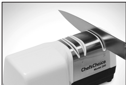
Рисунок 4. Нож на этапе 2. При заточке используйте движения вперед-назад с умеренным давлением вниз.