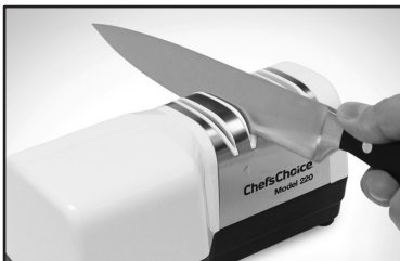
Рисунок 3. Вставка лезвия в правый слот ступени 1. Поочередно вставляйте лезвия в левый и правый слоты.

На рис. 2 показано, как проверить наличие заусенца. Действуйте следующим образом: Если последняя протяжка при заточке производилась в правом гнезде, то на правой стороне кромки лезвия должен быть небольшой заусенец. Если последняя протяжка была в левом гнезде, то вдоль левой стороны кромки должен быть небольшой заусенец. Если заусенец отсутствует, сделайте еще одну пару протяжек и снова проверьте наличие заусенца. Повторяйте поочередное выполнение пар правых и левых протяжек до тех пор, пока не образуется небольшой заусенец вдоль кромки. (Иногда заусенец образуется легче, если тянуть лезвие медленнее). Сделайте еще одну проводку и убедитесь в наличии заусенца по краю после каждой проводки. Только после этого можно приступить к этапу 2.