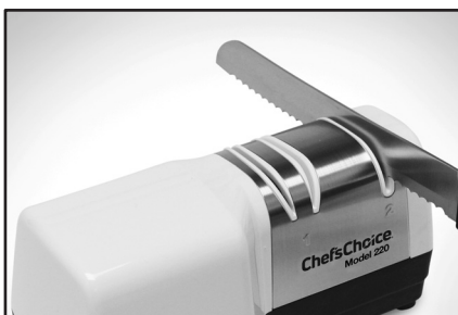
Рисунок 5. Зазубренный нож на этапе 2.